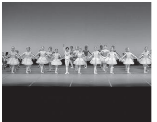
令和4年 飛騨洋舞家協会 バレエ合同発表会

飛騨洋舞家協会では、高山市文化協会と共に、バレエの振興と発展に寄与するため、加盟団体による合同発表会を毎年開催しています。