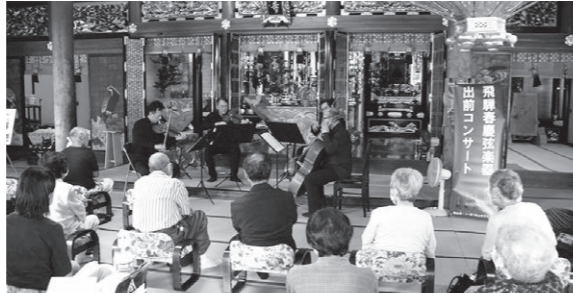
9月4日 山口町了心寺にて

高山市文化協会では、高山市の製作した春慶弦楽器を使ったコンサートを、市内の各地で開催しています。 これまでに六回のコンサートが開催され、延べ二百名近くの市民の皆様にお聞きいただきました。 次回は次の日程で開催します。いずれも無料でどなたでもお聞きいただける約一時間のコンサートです。ぜひお越しください。 第七回 遊朴館コンサート ◇日時 十一月十六日(木) 午後四時より 第八回 みはとコンサート ◇日時 十一月十七日(金) 午前十一時より 第九回 美鳩幼稚園 図書館コンサート ◇日時 十一月十七日(金) 午後二時より 第十回 高山市図書館「煥章館」石浦コンサート ◇日時 十一月十七日(金) 午後四時三十分より ◇会場 石浦町公民館