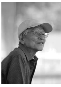
金沢21世紀美術館にて

陣屋前の朝市が片付けられ、と広場は急に閑散とした。そんな時、そのバスは赤い橋を渡ってこちらへと走ってきた。疾走しているというより、頑張って走っているという感じのボンネットバスである。