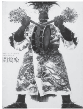
玉賢三作 ポスター原画(100cm×170cm) 「關鷄楽」1966年制作、日宣美展出品作品

「渡辺克則 戯画の世界」などの各事業を実施することができました。これもひとえに皆様方のご理解とご協力のおかげと、心から感謝申し上げます。 当協会においては、長期にわたって皆様が大変ご不便をお掛けしましたが、感染防止対策を徹底し、文化芸術鑑賞事業をはじめ、高山文化フォーラムや飛騨文芸祭、特別展