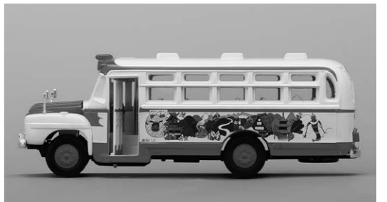
濃飛バスのボンネットバスにイラストを描く。1992年制作

（スタ）ができる前は、西口のヨドバシカメラ前から高速バスが発着していた。いくつもの路線を走るバスが到着するなかでひときわ目立ったのが松本からやってきたバスだった。ボディを彩る水玉と原始的な様相をみせるくねった草花、そしてビビットな色彩。群衆の目を釘付けにした絵は草間彌生が描いたものだった。その時も携帯電話を片手に僕はバスを追っていた。もし、玉賢三さん（以下玉さん）がデザインしたボンネットバスが新宿を走っていたら、そのいでたちは見る人に優しさや笑顔と、かつてどこかで聞いた懐かしいエンジン音をふりまき、都民の格好の被写体になったに違いない。