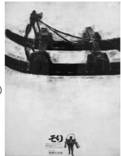
玉賢三作 原画 (72cm×103cm) 「飛騨民俗館・そり」 1965年制作、日宣美展出品 入選作品

いる。それにもかかわらず、離れて見るとなめらかで艶やまで感じ取れるのだ。人の目は筆の書き残しを想像で補えるのだろう。だから玉さんの